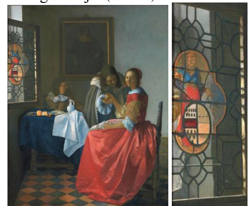
'Het meisje met het wijnglas' (ca. 1660)