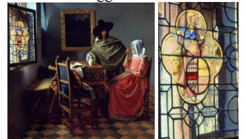
Johannes Vermeer (1632-1675): 'Het glas wijn' (ca. 1660)