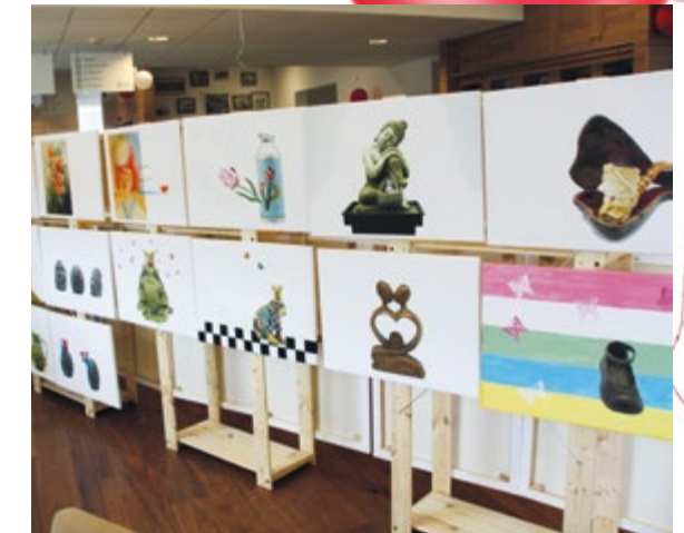
In onze versierde Plaza en Brasserie waren onder meer toneelvoorstellingen en verrassende optredens te zien.