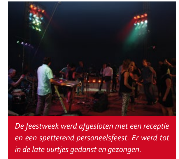
De feestweek werd afgesloten met een receptie en een spetterend personeelsfeest. Er werd tot in de late uurtjes gedanst en gezongen.