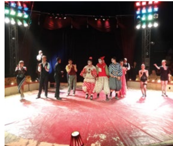
De voorstellingen in de sfeervolle piste waren grandioos. Ruim 2.000 mensen bezochten de circustent.